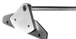
Streifenschneider S/01 Anschlag zum Schneiden paralleler Streifen bis 100, 250 und 500 mm